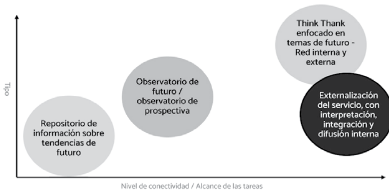
Organización de la Prospectiva Estratégica en las organizaciones. Tipología.